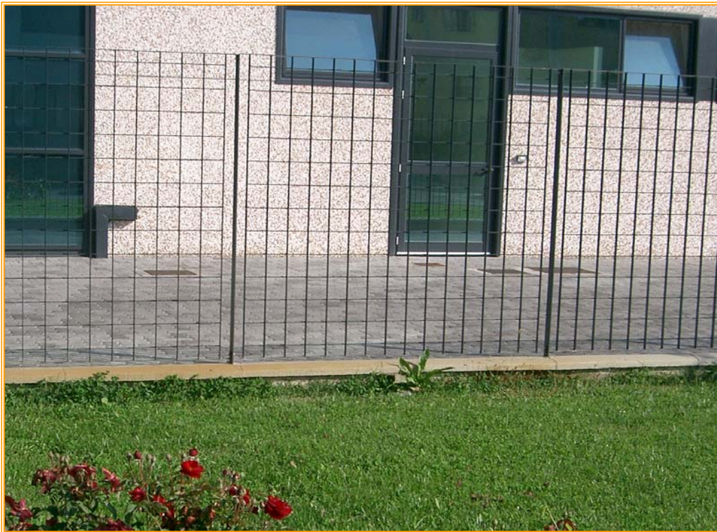
Recinzione modulare in grigliato elettrosaldato a maglia quadrata

Materiale: Acciaio S 235 JR (UNI EN 10025:1995)