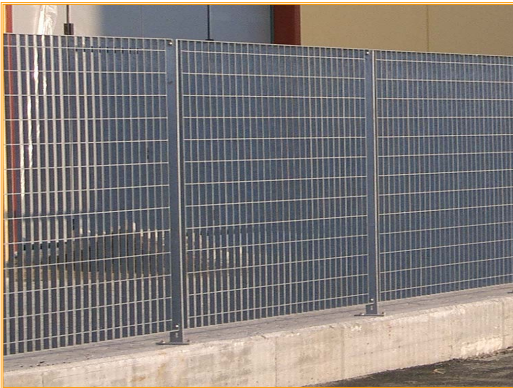
Recinzione modulare in grigliato elettrosaldato a maglia rettangolare

Materiale: Acciaio S 235 JR (UNI EN 10025:1995)