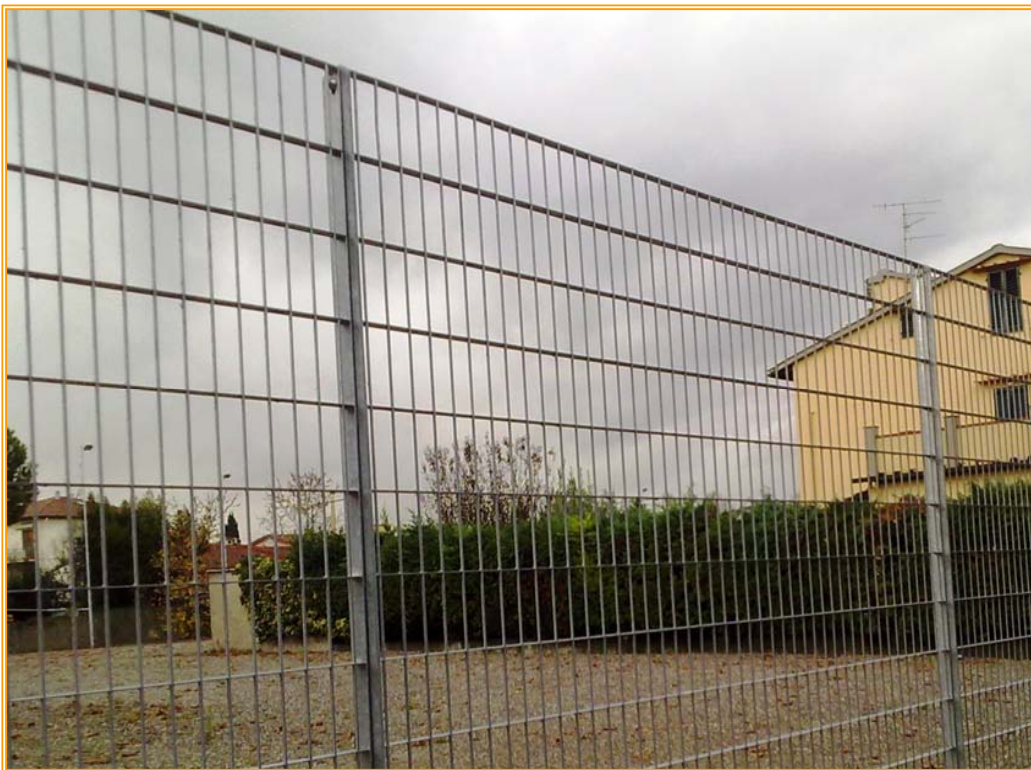
Recinzione modulare in grigliato elettrosaldato a maglia rettangolare

Materiale: Acciaio S 235 JR (UNI EN 10025:1995)