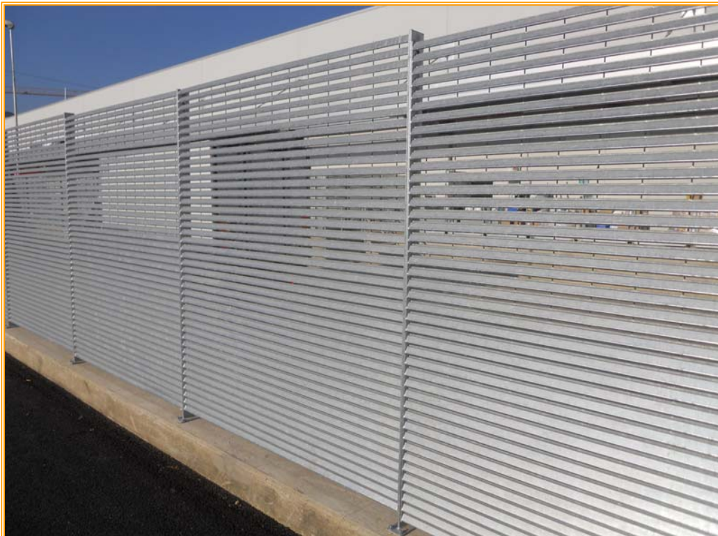
Recinzione modulare in grigliato elettrosaldato con profilo rompivisuale

Materiale: Acciaio S 235 JR (UNI EN 10025:1995)